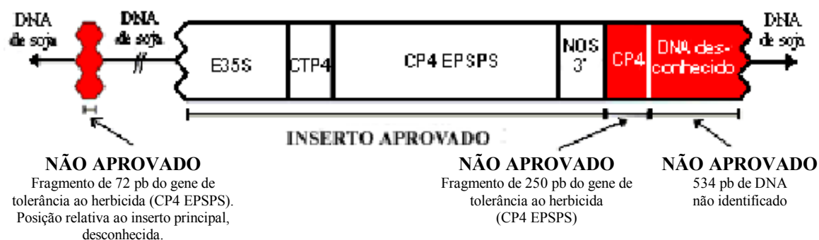
Figura: Esquema dos insertos de DNA na soja Roundup Ready da Monsanto.

Abreviaturas: pb = pares de base, unidade que indica o comprimento dos fragmentos de DNA; E35S = promotor do vírus de mosaico da couve-flor; CTP4 = sequência do peptídeo de trânsito do cloroplasto da petúnia; CP4 EPSPS = gene de tolerância a herbicida do Agrobacterium sp. , cepa CP4; NOS 3' = região não traduzida do gene de sintase nopalina. Ver notas no texto principal.